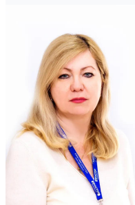
Иванова Светлана Николаевна

Тип сделки Продажа Тип продажи Свободная Новостройка Нет Год постройки 2006 Тип здания Панельный Планировка Раздельные комнаты Ремонт Косметический Лифт Да Балкон/Лоджия 1 балкон Отопление Центральное Санузел Раздельный Раздельных санузлов 1 Вид из окон На улицу Возможна ипотека Да