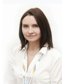
Пахоль Татьяна Юрьевна

Тип сделки Продажа Тип продажи Свободная Год постройки 2015 Тип здания Деревянный ВРИ ИЖС Ремонт требуется ремонта Высота потолков, м 2.75 м Балкон/Лоджия 1 балкон Санузел Совмещенный Возможна ипотека Да